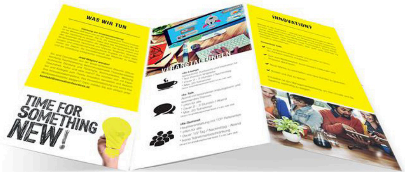
Folder: Zickzack-Falz, offene Größe A4